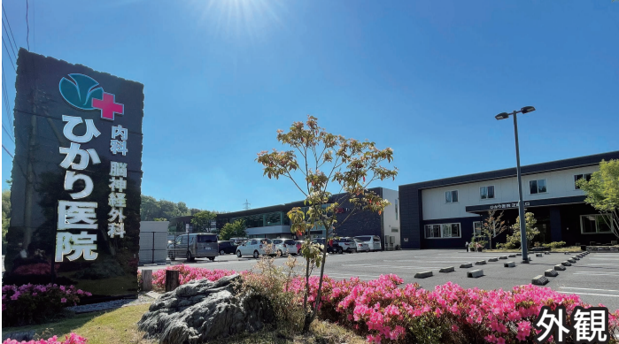
光総合病院 向かい側 写真の看板を目印にご来院ください。

当院は、従来の疾病や生活習慣病の予防などを行いながら、地域の皆様に親しまれ信頼される医療を目指しております。些細なことでもお気軽にご相談ください。