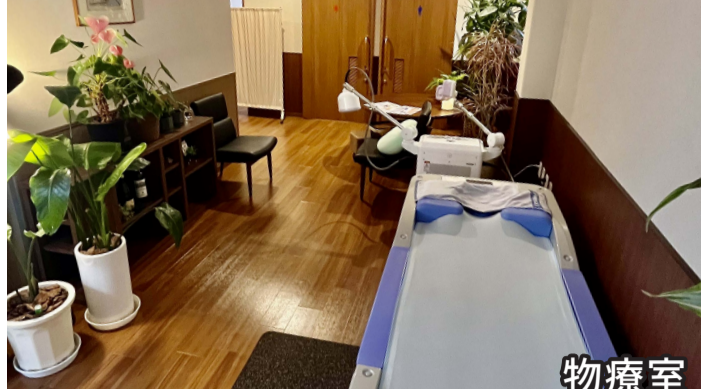
会計待ちにマイクロ波温熱器や ウォーターベッドで首・肩・腰の痛みの緩和を。