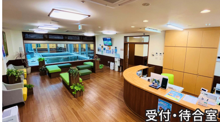
錦鯉が泳ぐ中庭を眺めながら、 ゆったりとくつろげる待合室です。