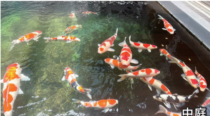
明るい日差しが降り注ぐ中庭では 錦鯉がゆったり泳ぐ姿が見られます。